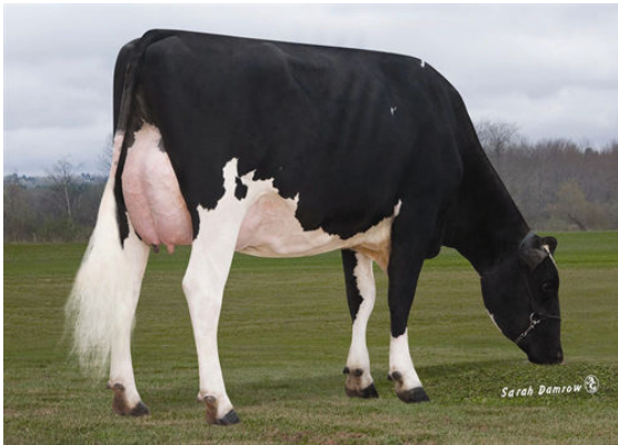
REDCARPET MASTERPIECE ARMS