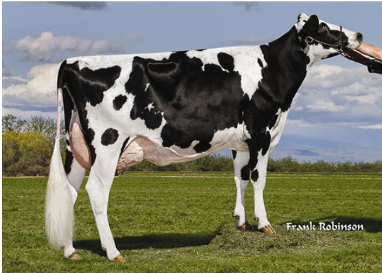
COSTA-VIEW MASTERPIECE 49311