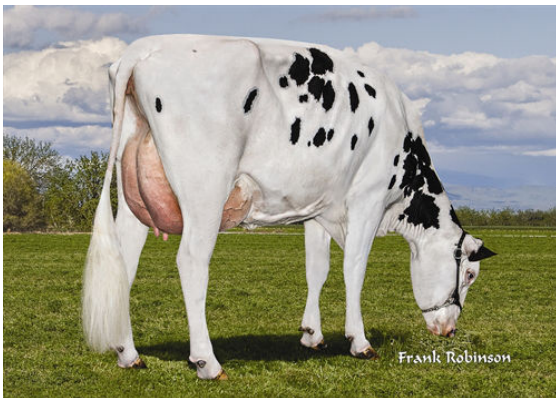
AIR-OSA MASTERPIECE 16729